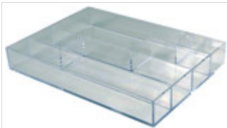
Plateau 6 compartiments pour les boites LAB 5 et LAB 6